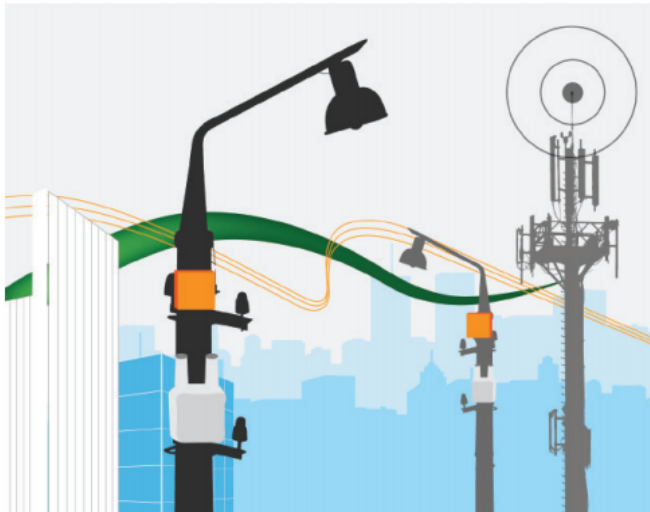
EtherHaul - 600TX